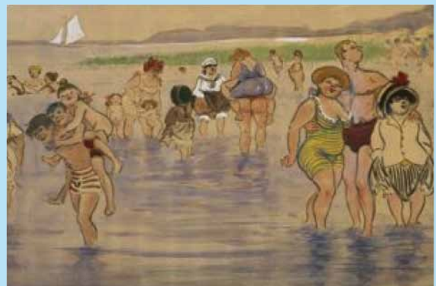
So sah Zille das Wannseeproblem

Ein Ausflug in die wunderschöne Anlage des Liebermannhauses mit Blick über den Wannsee lohnt sich immer! (Tägl. außer Di! 10-18 Uhr)