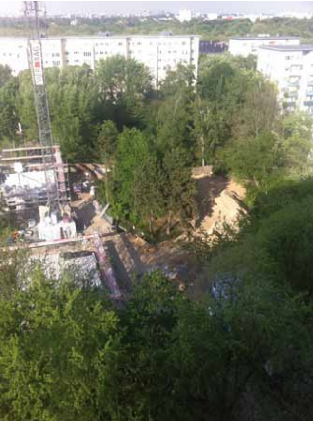
Baustelle Ursulastraße. Hier war mal ein Park

Die Arbeiten am Hochhaus Havensteinstraße 20/22, dessen Modernisierung vollmundig als ‚Zukunftshaus, Pilotprojekt mit Modellcharakter für die ganze Siedlung‘ annonciert wurde, sind inzwischen abgeschlossen. Reingebastelt, nachdem sämtliche