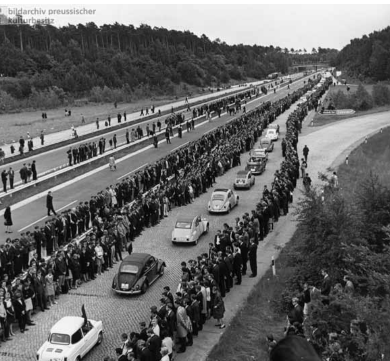
Die Teilnehmer des Trauerzugs stehen Spalier für den Konvoi nach Hannover

Im Gegensatz zu manchen Freunden war ich an der Oper mit ein paar Knüppelschlägen auf die Arme glimpflich davon gekommen. Aber es gab kein Grundvertrauen mehr – „wir“ (eine nicht weiter definierte Gruppe von irgendwie linken Studierenden) standen nahezu dem gesamten Rest – Regierung, Polizei, Presse, große Teile der Bevölkerung – feindlich gegenüber. Als Ostern 1968 der Gelegenheitsarbeiter Bachmann, aufgehetzt von der Springer-Presse, Rudi Dutschke niederschoss, attackierten mehrere tausend Studenten am Abend das Springer-Hochhaus in der Kochstraße, Auslieferungsfahrzeuge gingen in Flammen auf. Auch in westdeutschen Großstädten gab es wütende Proteste gegen die Springer-Zeitungen. Es ist si-